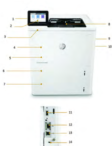
Abbildung: HP LaserJet Enterprise M608x