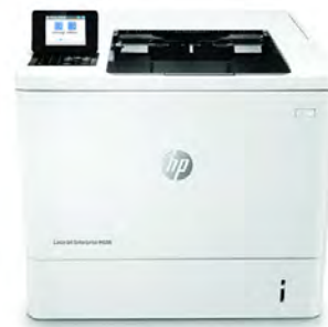
HP LaserJet Enterprise M608dn