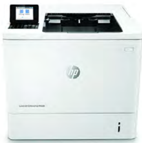
HP LaserJet Enterprise M608n

Dieser HP LaserJet Drucker mit JetIntelligence kombiniert herausragende Leistung und Energieeffizienz mit Dokumenten in professioneller Qualität zum richtigen Zeitpunkt – Ihr Netzwerk bleibt dabei durch die branchenweit umfassendsten Sicherheitsfunktionen geschützt 1